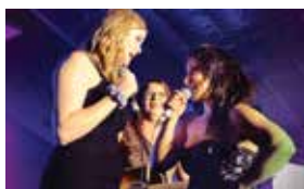
Les Ticky Jones